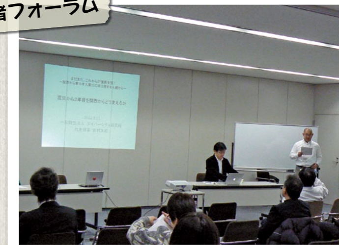
被災者支援を継続している組織、およびこれから実施しようとす るNPOや社会起業家、企業などがそれぞれの強みを補完し合 い、継続して関西から支援を続けるためのトークセッションおよび ワークショップを実施しました