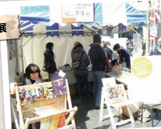
復興支援のチャーリ ティ商品の販売ブー スや、ボランティア相談 など、参加団体の特 徴やこだわりを生か した取り組みを紹介