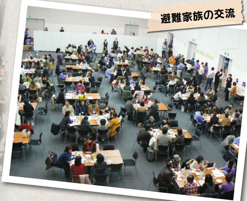
関西の避難家族の方の体験談や交流企画を実施し、 支援情報を提供。119世帯、295人に参加いただきま した。物資提供や保育スペースなども設けました