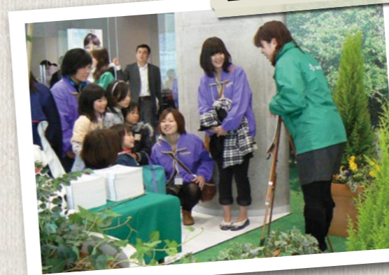
イベント連動企画として、「おもてなしプロ ジェクト」を3.11前後約2ヵ月間にわたり、 関西各地で実施。関西企業による支援企画 をカタログにまとめて避難家族へ提供。写 真は、避難家族の写真撮影プロジェクト