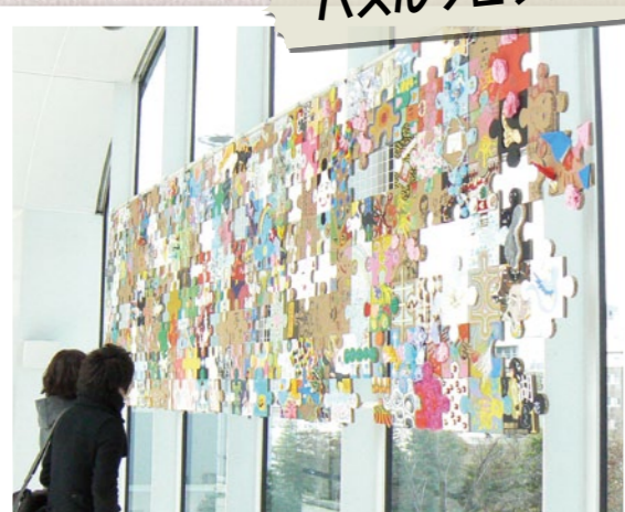
被災者も含め、600人を超える参加者が復興 への思いを込めて作ったパズルをつなぎました