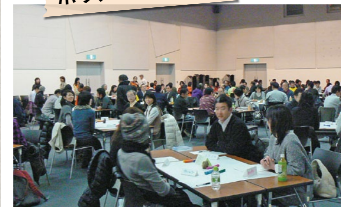
ボランティアとして復興活動に取り組んだ人を中心に ワールドカフェ方式で活動を振り返り、今後を考えました