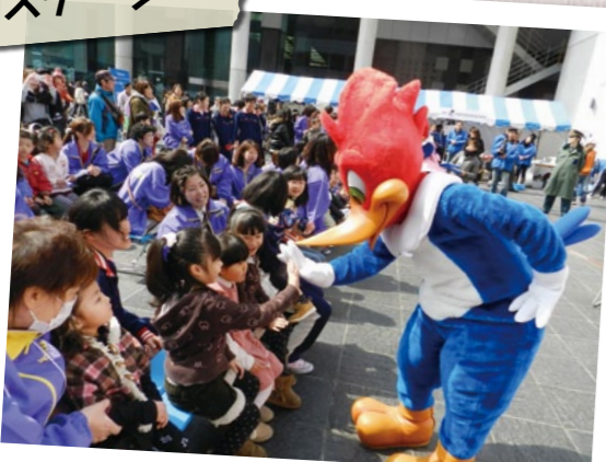
人気キャラクターの登場で、こどもたちも大はしゃぎ